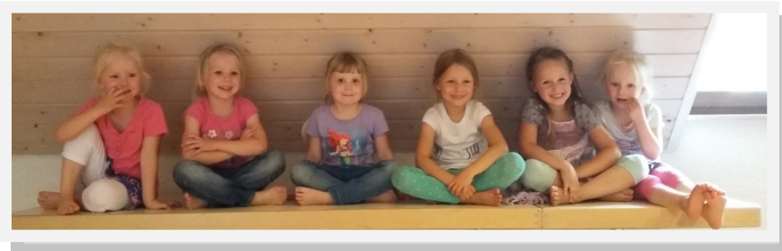
... ein Teil der Minis am 15.06.2018.

Willst Du mit Deinem/n Kind/ern dabei sein?