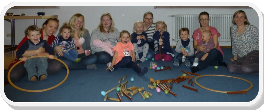
Die Minis am 23.03.2018 und...